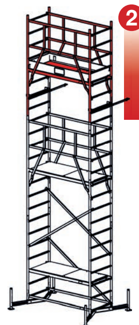
2. Patro 1. Patro Základní lešení Obj. číslo 710147 Obj. číslo 710123 Obj. číslo 710116